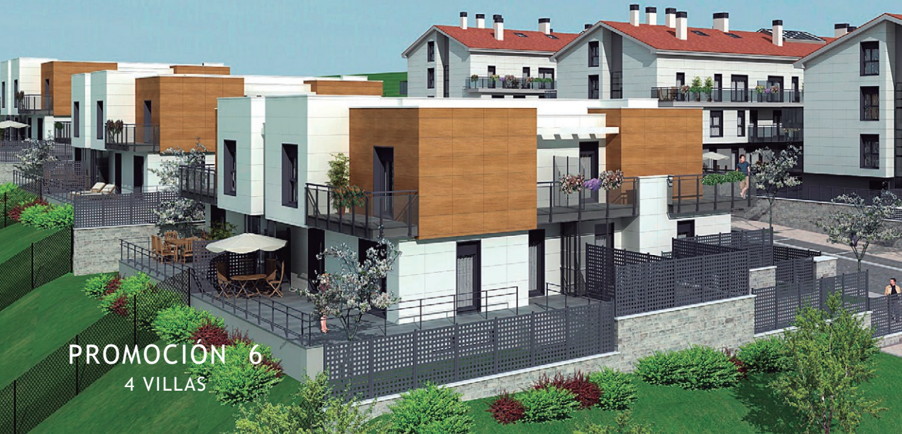
PROMOCIÓN 6 4 VILLAS