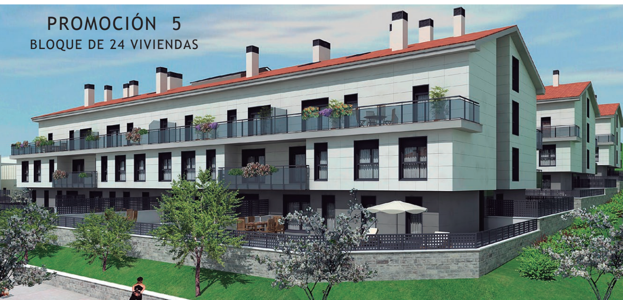
PROMOCIÓN 5 BLOQUE DE 24 VIVIENDAS