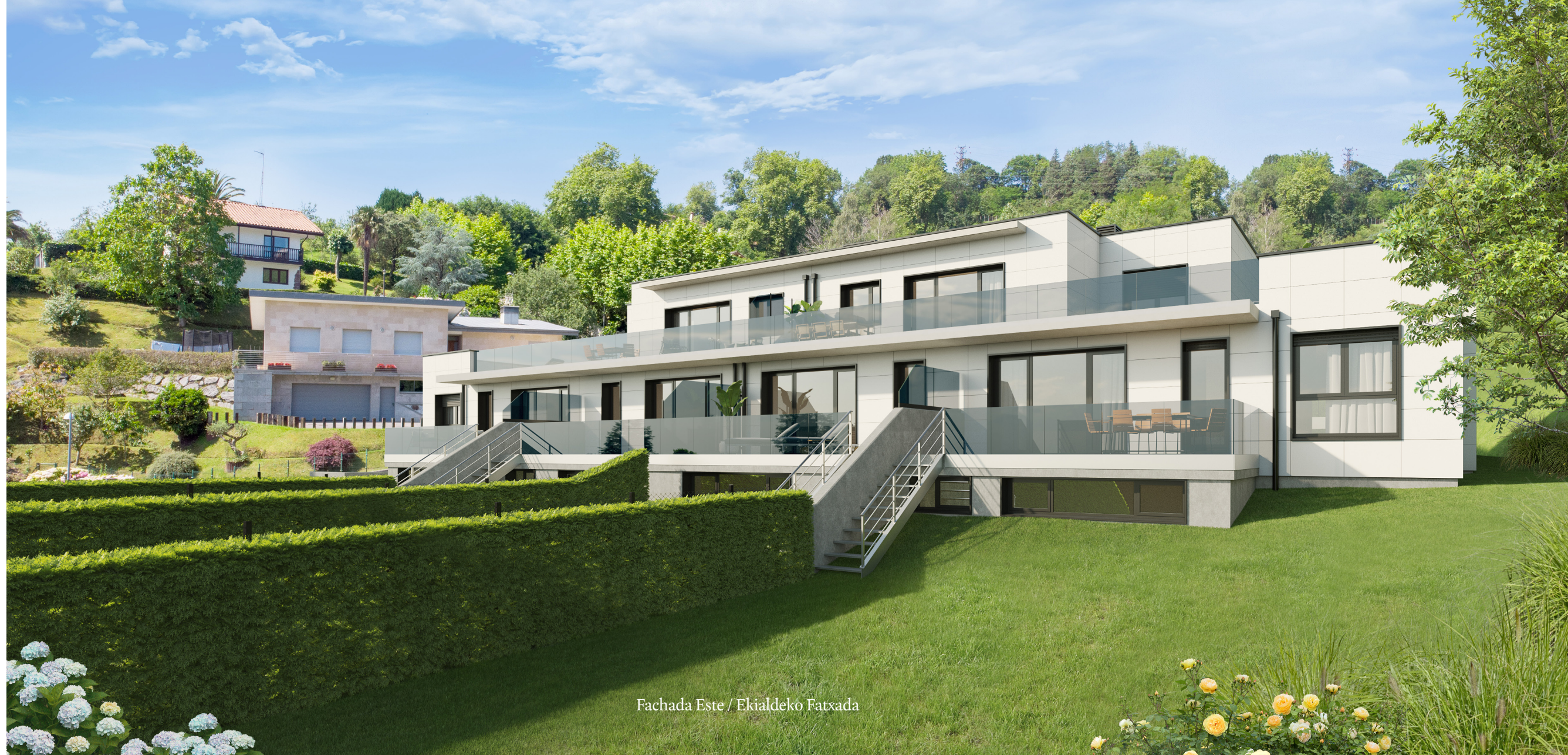
Fachada Este / Ekialdeko Fatxada